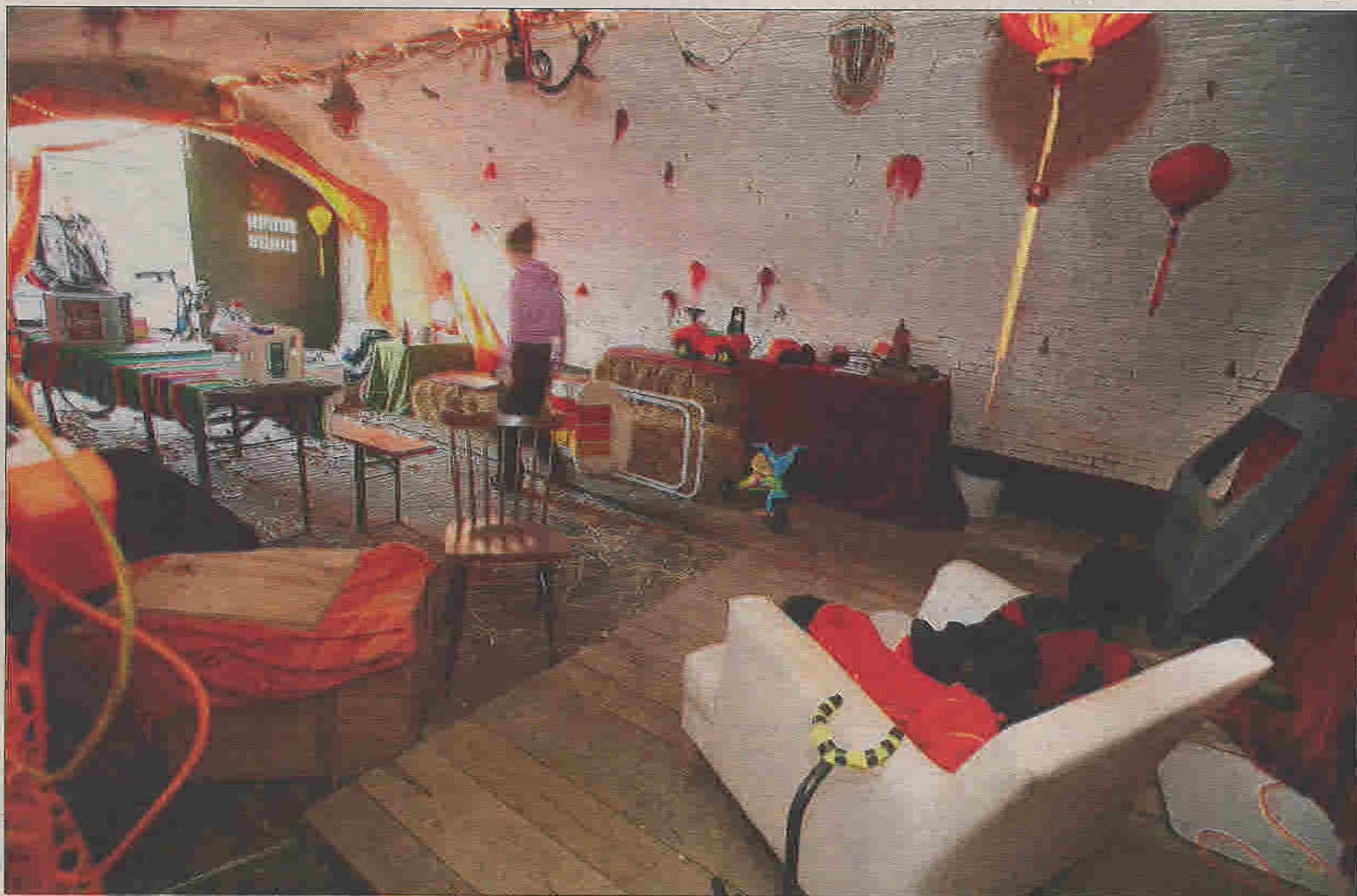
Fort Werk aan het Spoel, tot de jaren negentig onderkomen van de EOD en nu gekraakt, krijgt een nieuwe bestemming.